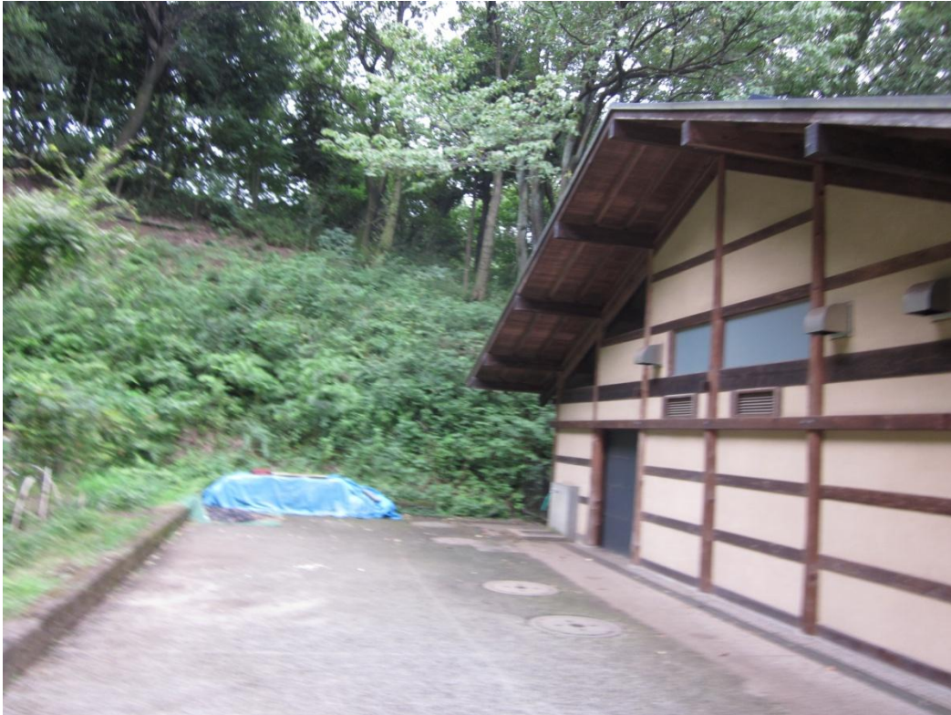
自転車で走りながら撮ったらブレました。