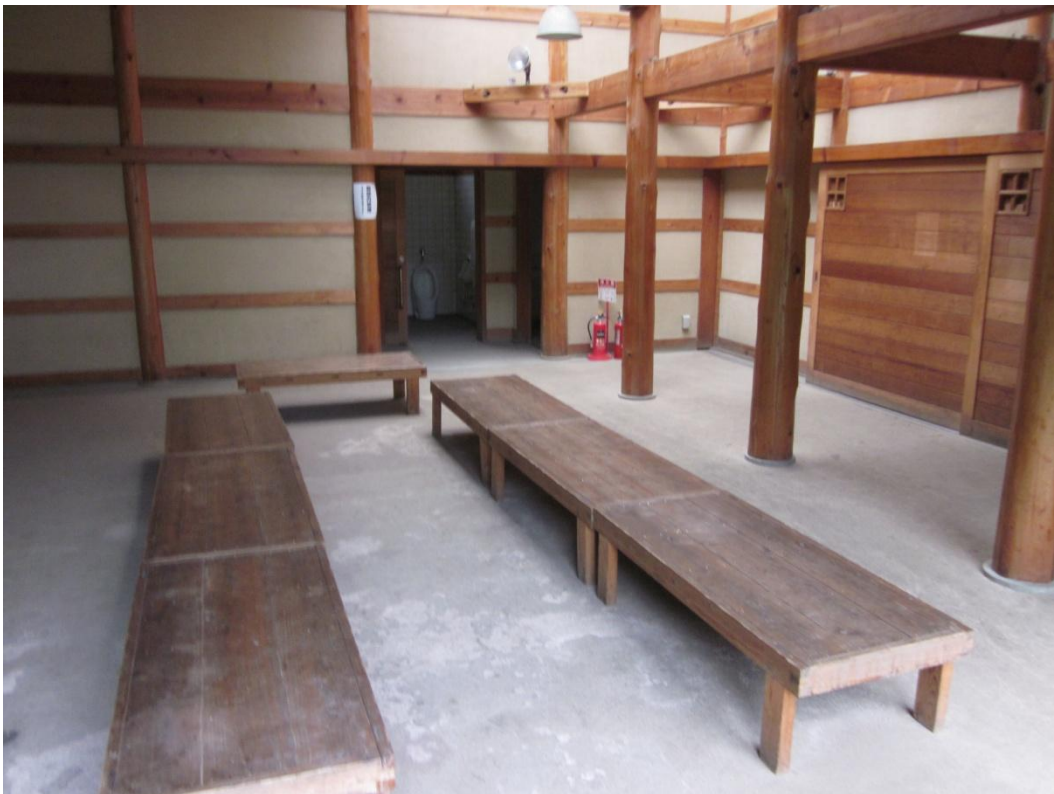
休憩所なので、休憩できます。