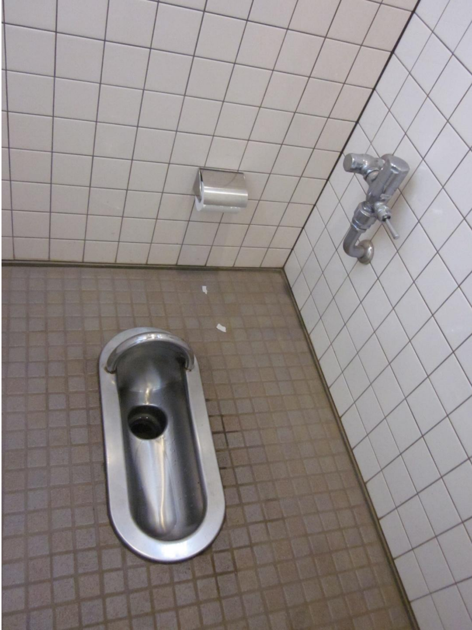
なんか変だな~と思ったら、女子トイレだった。