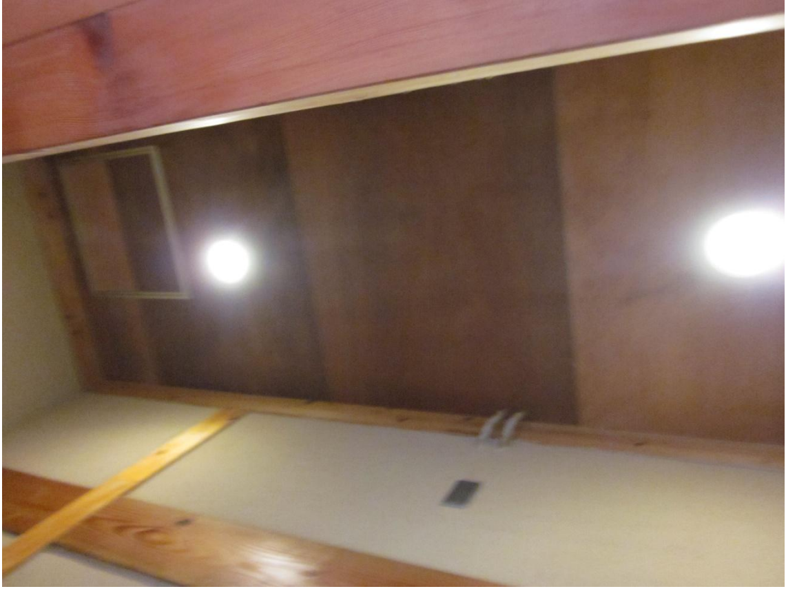
前室にも照明がある。