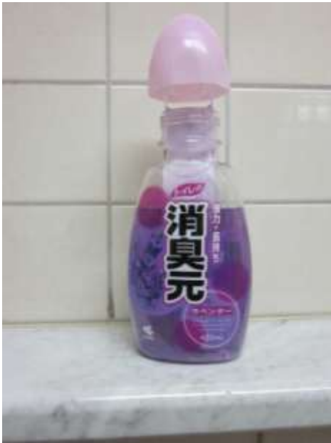
消臭元のおかげでニオイなし。