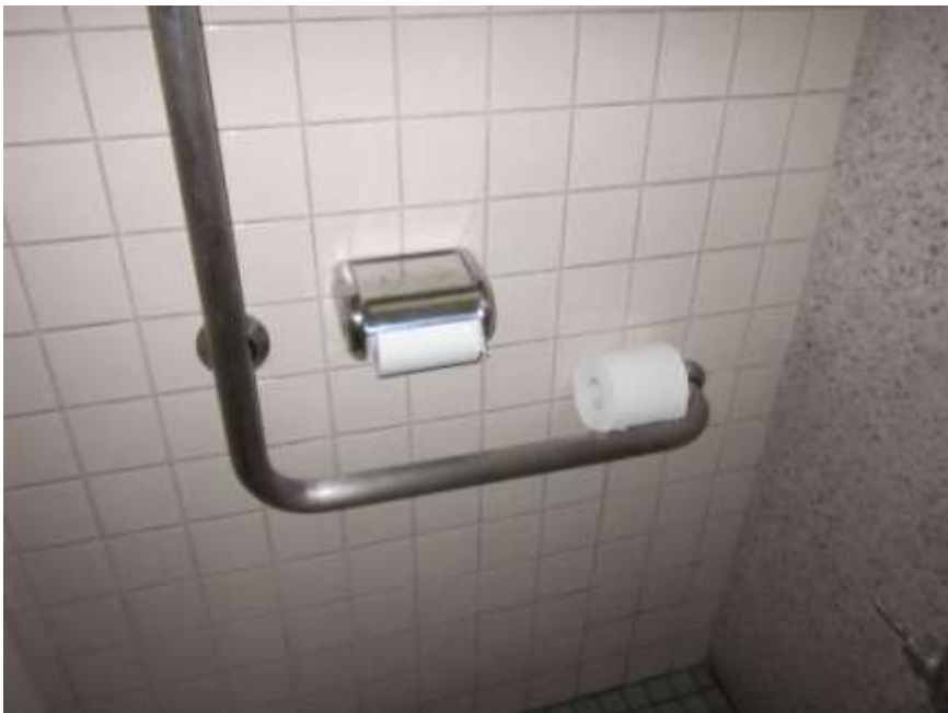
トイレトーパーも完備。