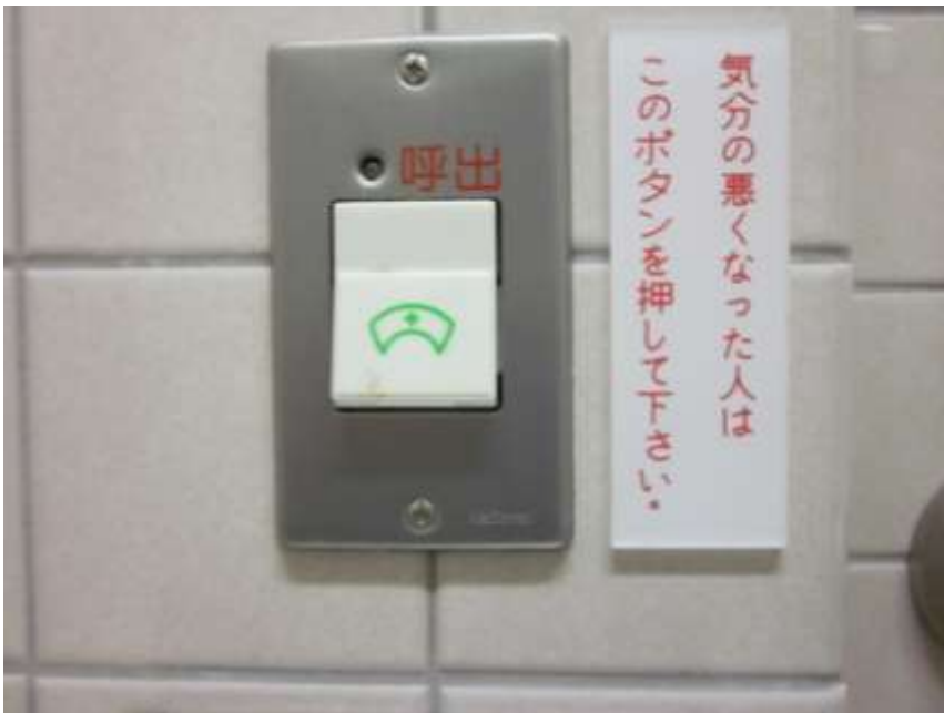
ヤバイ時はこれを押せばいいのだろう。